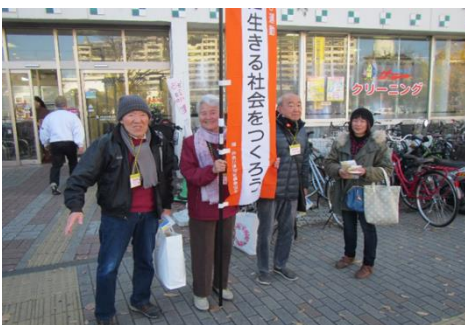
【昨年の街頭キャンペーンの様子】

12月4日（火）午前10時から本郷台駅前、障害のある当事者の方や支援をされている方々が啓発用のチラシやポケットティッシュを配布します！ぜひ、お手に取っていただき、「だれもが共に生きる社会」について、考える機会にさせていただければと思います。