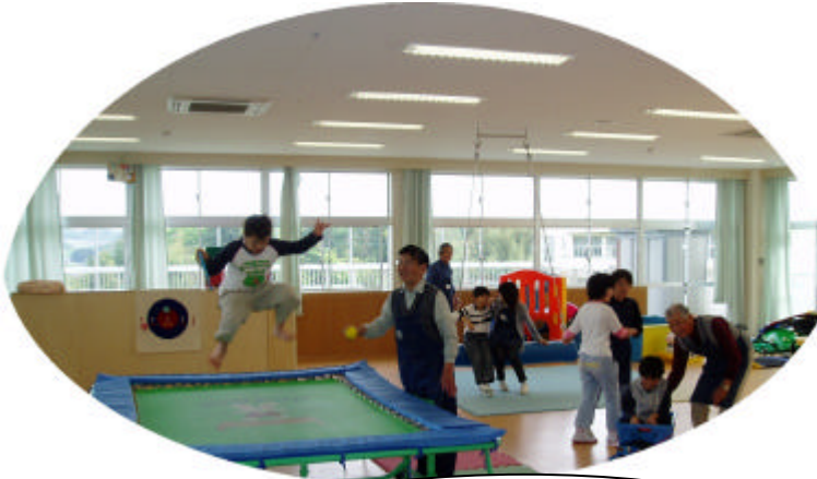
トランポリン遊び！ ボランティアが見守ります