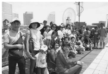
社会科見学行事もあります。

我々日本人でも正しい日本語を忘れがちな日常生活の中、難しい日本語を学ぶ姿勢は頭が下がる思いでした。ある学習者は、「4年前から、また受け始めました。先生も優しく、楽しく教えていただきわかりやすいので、これからも続けていきたい」と話してくれました。代表の方は、「この会の教材は全て手作り、主に日本語で教えています。ボランティアも月2回勉強会をして常に会の向上をはかっています。」と語られていました。また、「日本語が難しいからこそ、正しい日本語を教えることが大事」という言葉がとても胸に響きました。